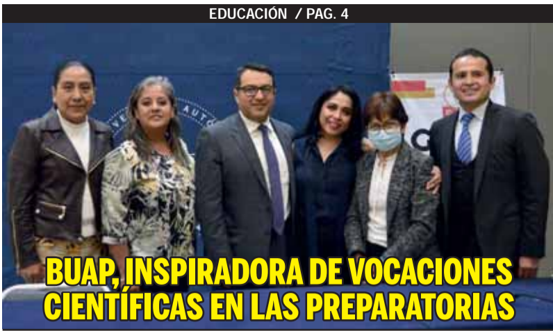
BUAP, INSPIRADORA DE VOCACIONES CIENTÍFICAS EN LAS PREPARATORIAS