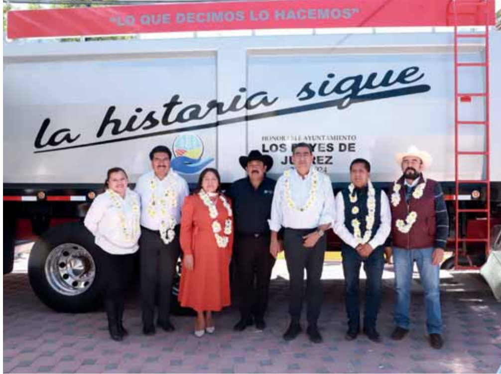
EL MANDATARIO PRESIDÓ LA INAUGURACIÓN DE LA RECONSTRUCCIÓN DE LA CARRETERA ACATZINGO-SAN SALVADOR HUIXCOLOTLA

ACATZINGO, Pue.- El gobierno de Puebla consolida el desarrollo en este municipio con total transparencia y eficacia, manifestó el gobernador Sergio Salomón al presidir la inauguración de la reconstrucción de la carretera Acatzingo-San