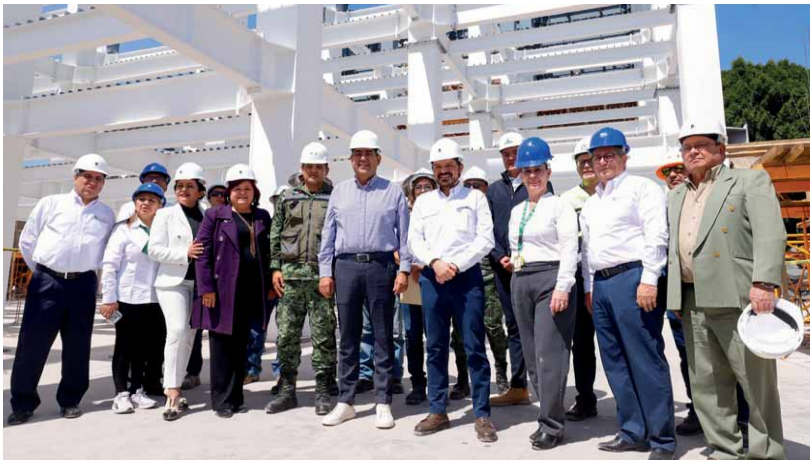
► El gobernador Sergio Salomón y el director general del IMSS, Zoé Robledo Aburto supervisaron el avance de la construcción del hospital de San Alejandro.