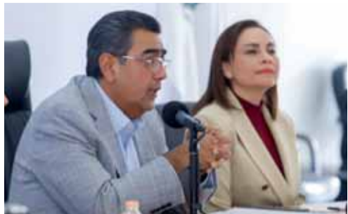
EL GOBERNADOR INSTALÓ LA PRIMERA SESIÓN ORDINARIA DEL SIPINNA Y EL SUBCOMITÉ ESPECIAL DE NIÑAS, NIÑOS Y ADOLESCENTES 2024