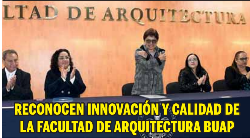
RECONOCEN INNOVACIÓN Y CALIDAD DE LA FACULTAD DE ARQUITECTURA BUAP