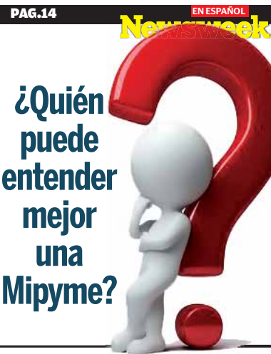
¿Quién puede entender mejor una Mipyme?