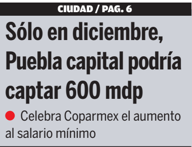
Sólo en diciembre, Puebla capital podría captar 600 mdp ● Celebra Coparmex el aumento al salario mínimo