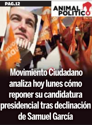
Movimiento Ciudadano analiza hoy lunes cómo reponer su candidatura presidencial tras declinación de Samuel García