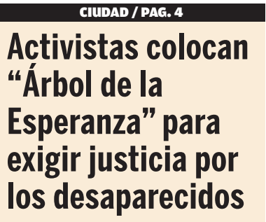
Activistas colocan "Árbol de la Esperanza" para exigir justicia por los desaparecidos

● El arzobispo de Puebla, Víctor Sánchez Espinosa, desaprobó el clima de inseguridad, violencia y asesinatos, que privilegia la cultura de la muerte, enfatizó que hoy por hoy, la cultura de la muerte se normaliza desde que los niños están cercanos a videojuegos en los que se gana matando, donde los padres no se dan cuenta que, con este ambiente se van creando una falsa realidad, donde al final hay una afectación en su mente. PÁG. 5