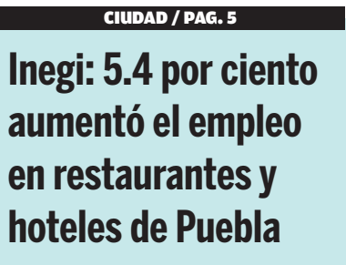
Inegi: 5.4 por ciento aumentó el empleo en restaurantes y hoteles de Puebla