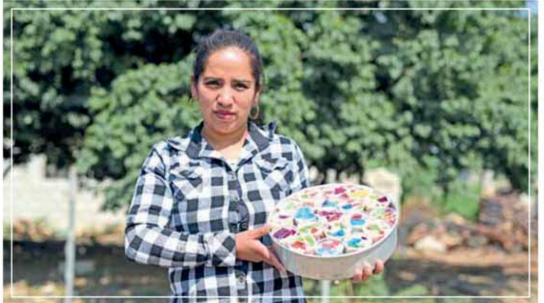
BENEFICIA GCM CON CURSOS A 1 MIL 100 PERSONAS EN 52 POBLACIONES