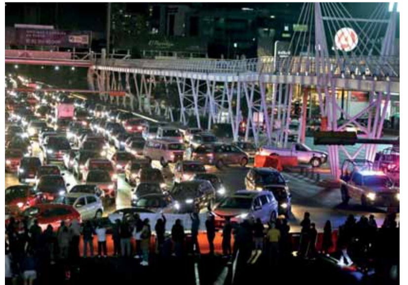
● EN LA NOCHE, EN LA ZONA DE ANGELÓPOLIS