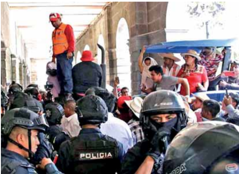
● A MEDIO DIA EN EL CENTRO HISTÓRICO