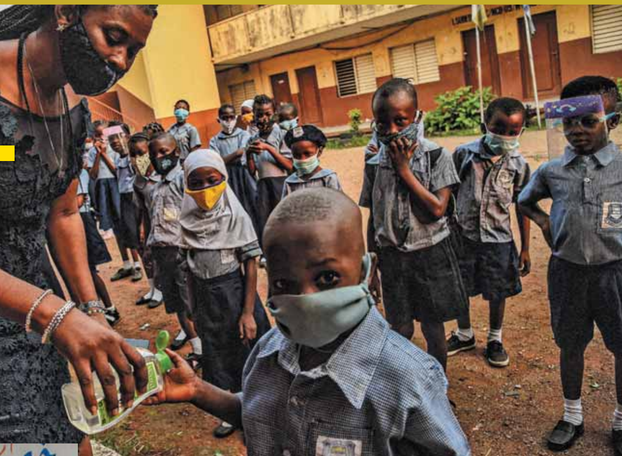
NIGERIA Una maestra aplica desinfectante de manos a un alumno en una primaria de Lagos, Nigeria, en enero de 2021.