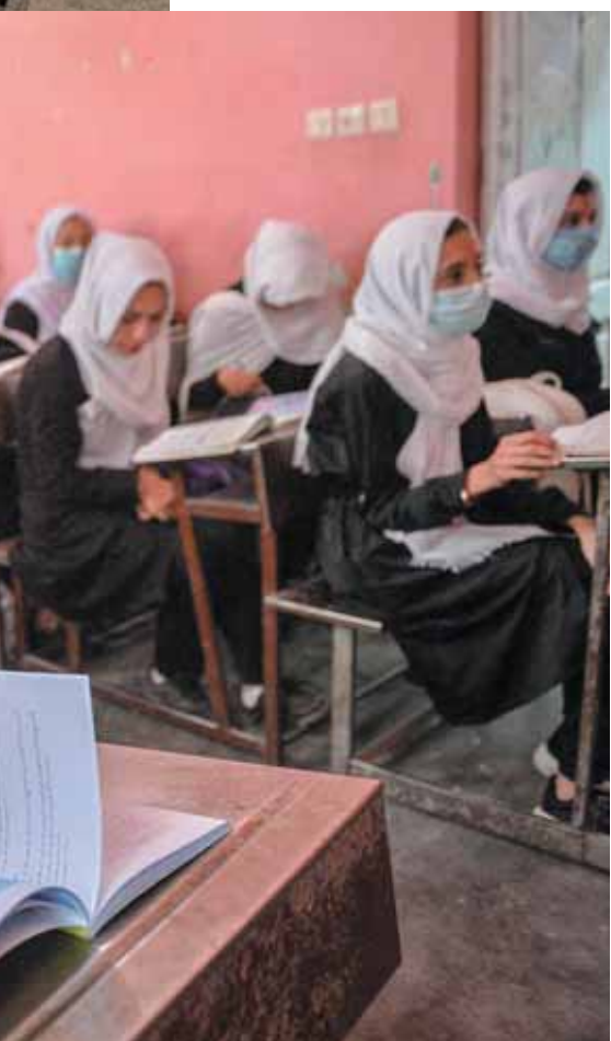
AFGANISTÁN Un grupo de niñas toma clase en una escuela de Herat, Afganistán, en mayo de 2021.