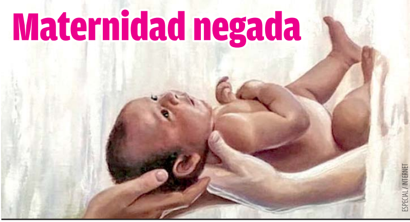
ESPECIAL / INTERNET