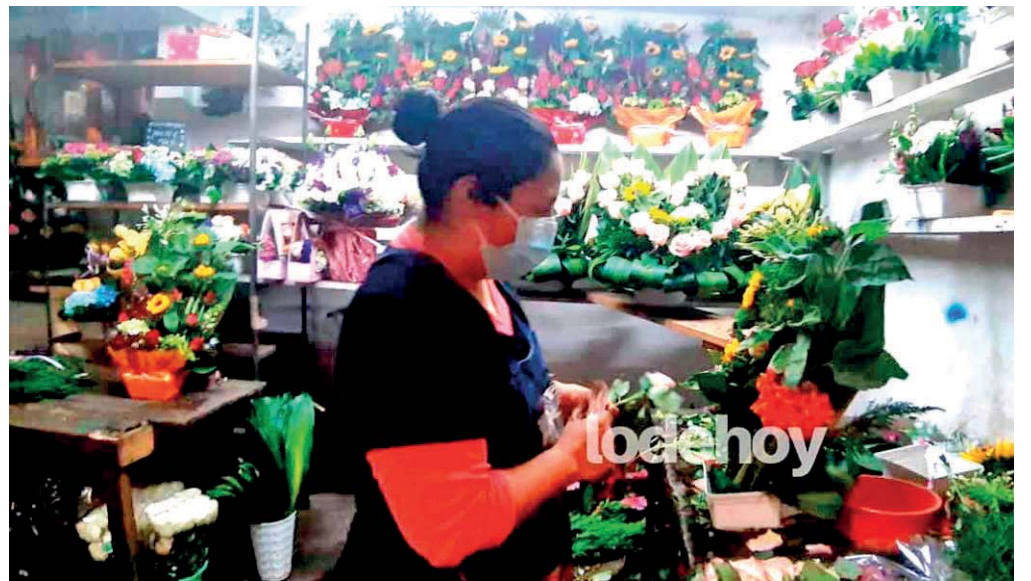
Los precios oscilan desde los 100 hasta 500 pesos, todo depende del modelo y de la flor que se ocupe.

Para concluir, declaró que una vez que termine la temporada del Día de