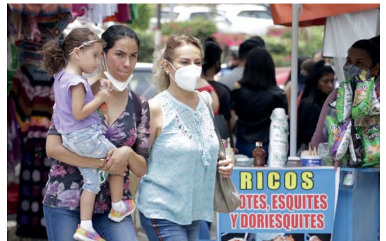
Esto en el marco del Día de la Madre, pidió valorar a las madres y a defender la vida desde la concepción.

Finalmente, también pidió por el Puebla de Colombia, ya que dijo que antes de ser arzobispo de Puebla, estuvo dos años en la ciudad de Medellín, pueblo que está en nuestro continente y que vive una situación difícil de represión por parte del gobierno.