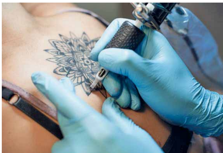
Destacó que las recomendaciones de sus clientes es lo que ha permitido mantenerse a flote para generar recursos.