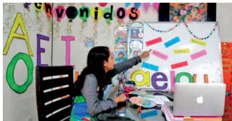
El titular de SEP, Melitón Lozano Pérez, informó que ya hizo la petición de manera formal para cubrir la plantilla laboral de más de 140 mil trabajadores de todos los niveles educativos.

La Secretaría de Educación (SEP) en Puebla, dio a conocer que solicitó a la Federación 143 mil 625 dosis de la vacuna contra el SARS-CoV-2 para los trabajadores de la educación en la entidad poblana.