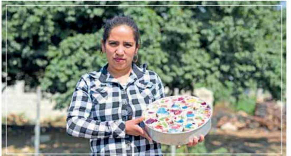
BENEFICIA GCM CON CURSOS A 1 MIL 100 PERSONAS EN 52 POBLACIONES