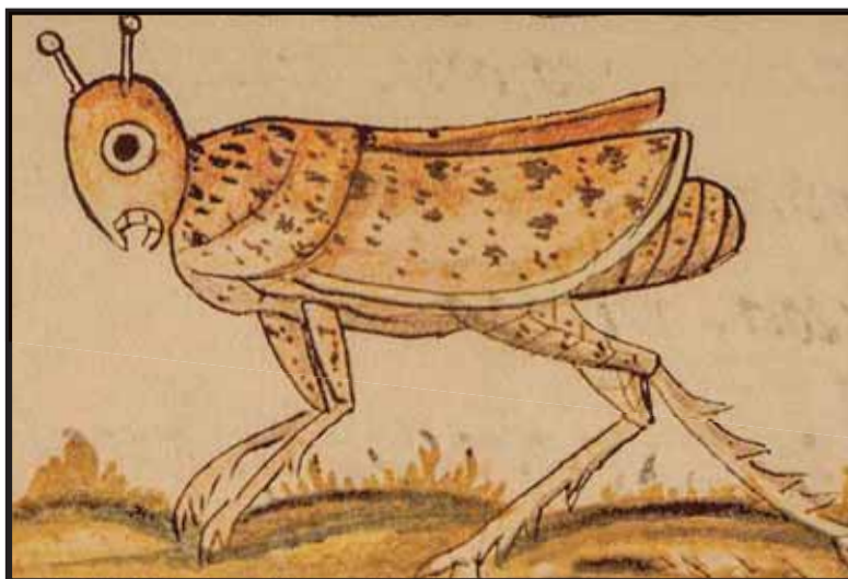
DE LAS LANGOSTAS 1540-1585 Bernardino de Sahagún