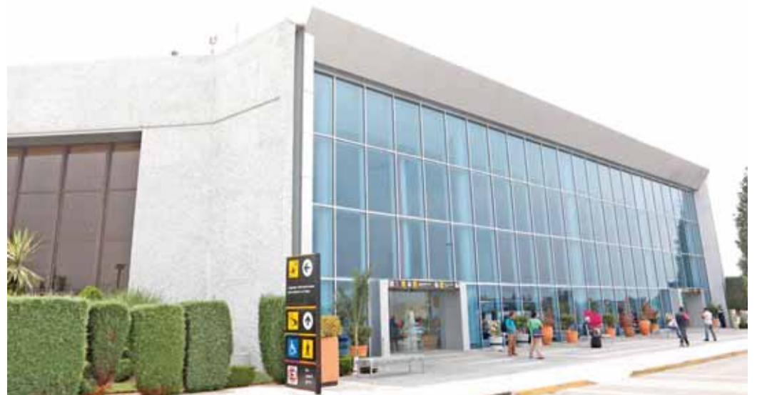
El simulacro se denominó "Incendio Estructural de Aeronave", en la cabecera 35 de la pista de la terminal aérea.