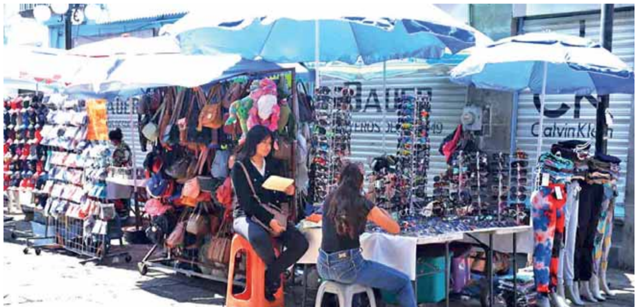
La falta de limpieza, pero sobre todo las malas decisiones gubernamentales han afectado a los empresarios, Riestra.