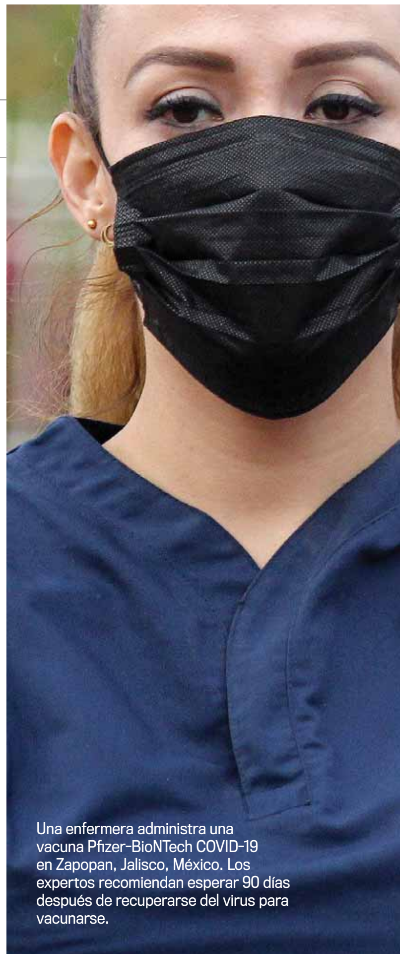
Una enfermera administra una vacuna Pfizer-BioNTech COVID-19 en Zapopan, Jalisco, México. Los expertos recomiendan esperar 90 días después de recuperarse del virus para vacunarse.

“Por ello, mientras el suministro de vacunas siga siendo limitado, las personas con una infección aguda de SARS-CoV-2 reciente y documentada pueden decidir, si lo desean, retrasar temporalmente la vacunación,