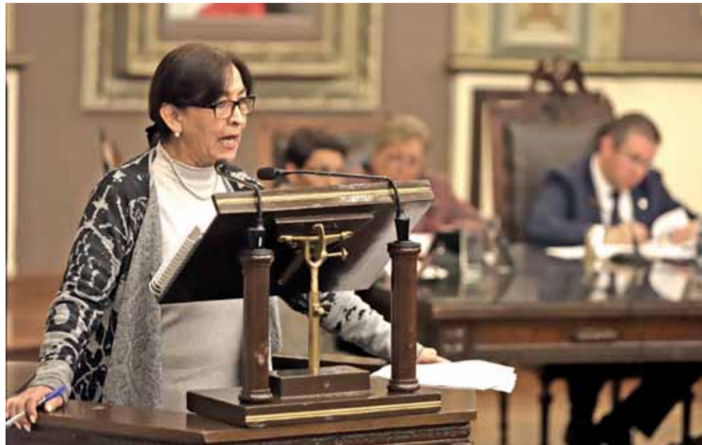
GARCÍA OLMEDO señaló que no se respetó el principio de equidad en la selección.