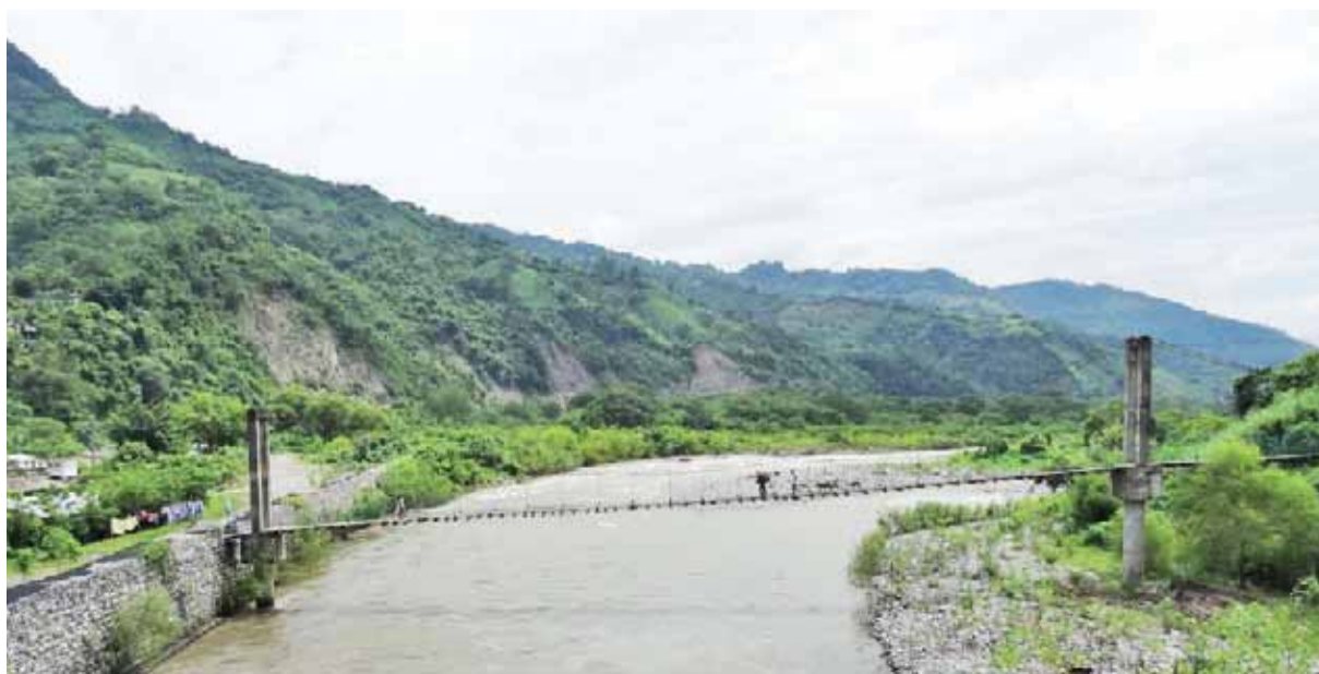
GOBERNACIÓN ya tomó las medidas de prevención.

En otro orden de informó que la dependencia a su cargo ya emitió los lineamientos a seguir durante las celebraciones del 15 y 16 de septiembre para los 217 presidentes municipales del estado.