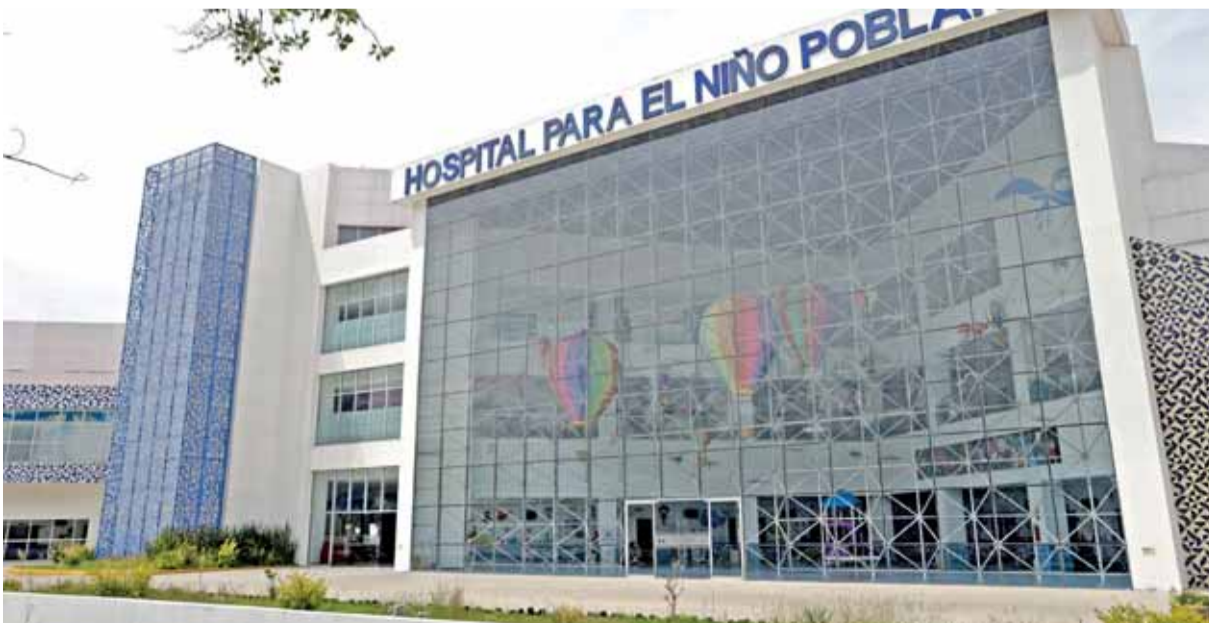
LOS TRABAJADORES del HNP siguen a la espera de un incremento al salario retroactivo.