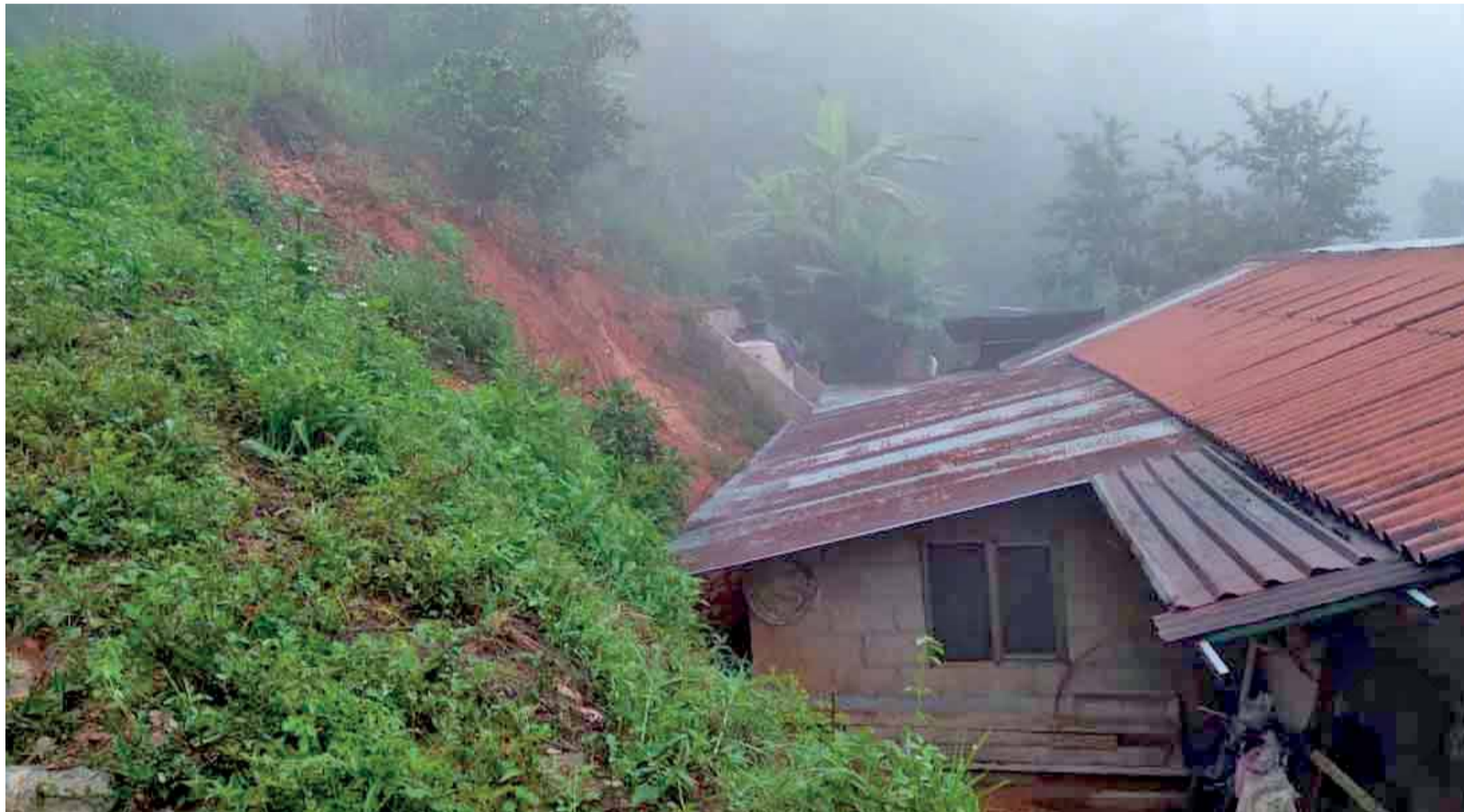
PROTECCIÓN CIVIL, La Guardia Nacional y el Ejército recorren varias comunidades donde se registraron derrumbes.

► Las familias son evacuadas ante el riesgo