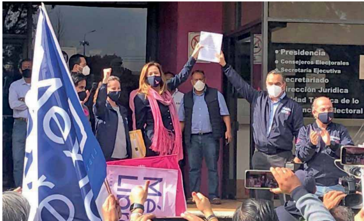
LA PAREJA impulsora de México Libre realizó un mitin a las afueras de las oficinas del instituto.