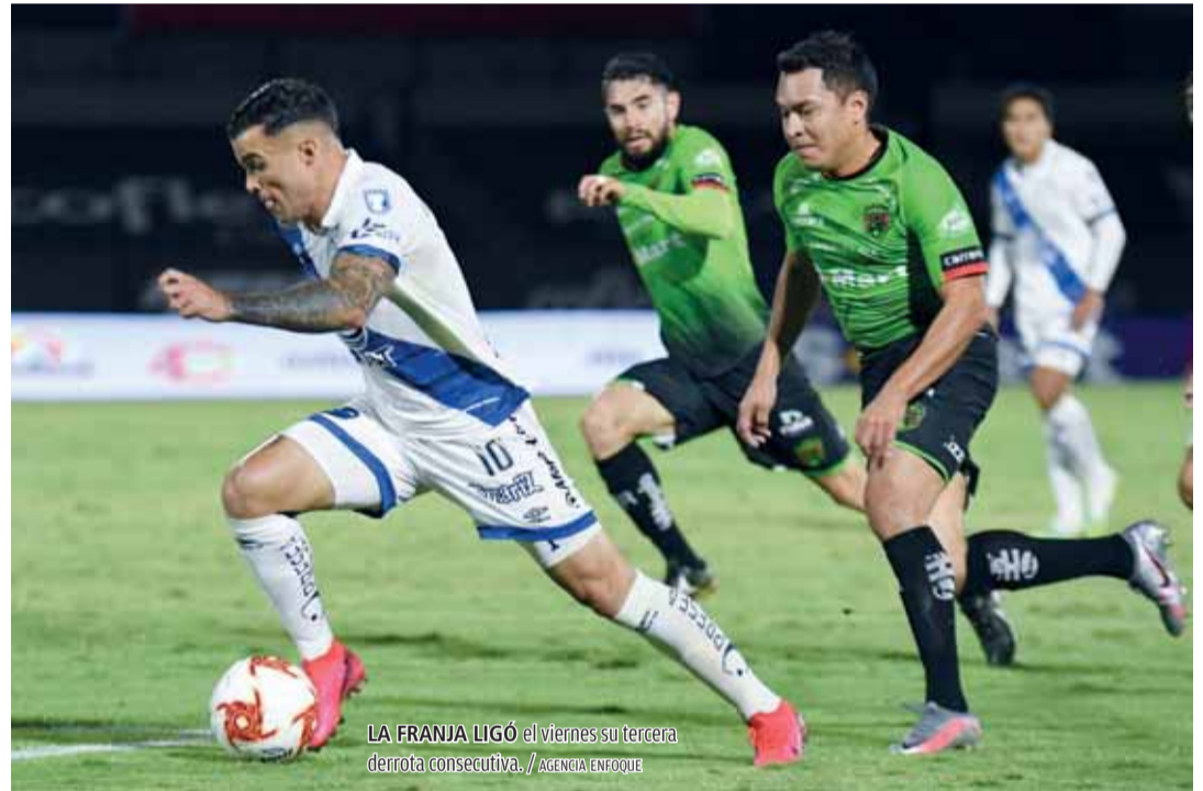
LA FRANJA LIGÓ el viernes su tercera derrota consecutiva.