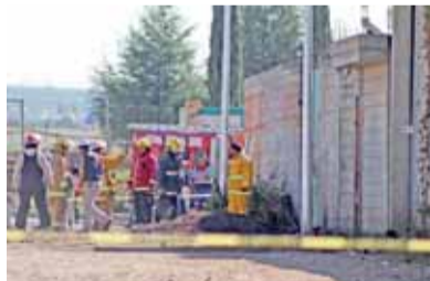
PROTECCIÓN CIVIL señaló la dificultad en hallar las tomas clandestinas.