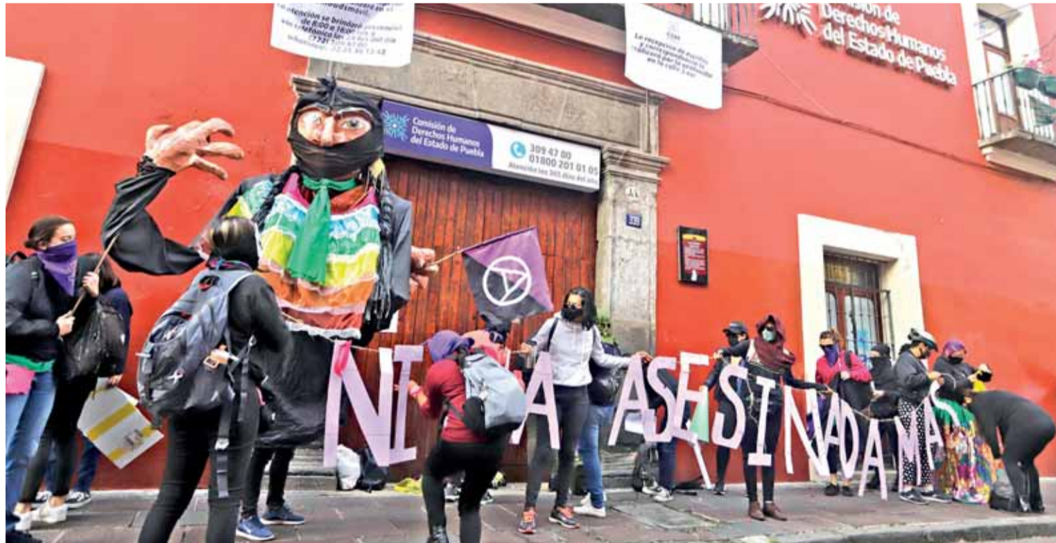
ALREDEDOR DE 30 integrantes de colectivos señalaron que las autoridades estatales no garantizan la ley de protección a las mujeres.

► La sede de la Comisión de Derechos Humanos fue tomada de forma simbólica el viernes