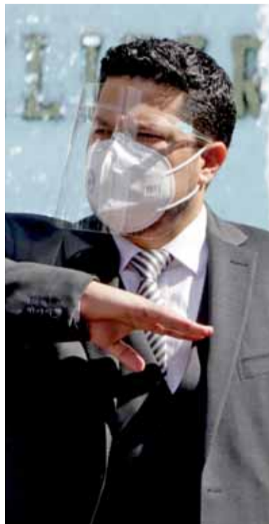
EL LÍDER de la bancada de Morena encabeza la Jugocopo en el Legislativo.

Refirió que una de las fuerzas políticas que ha mantenido su