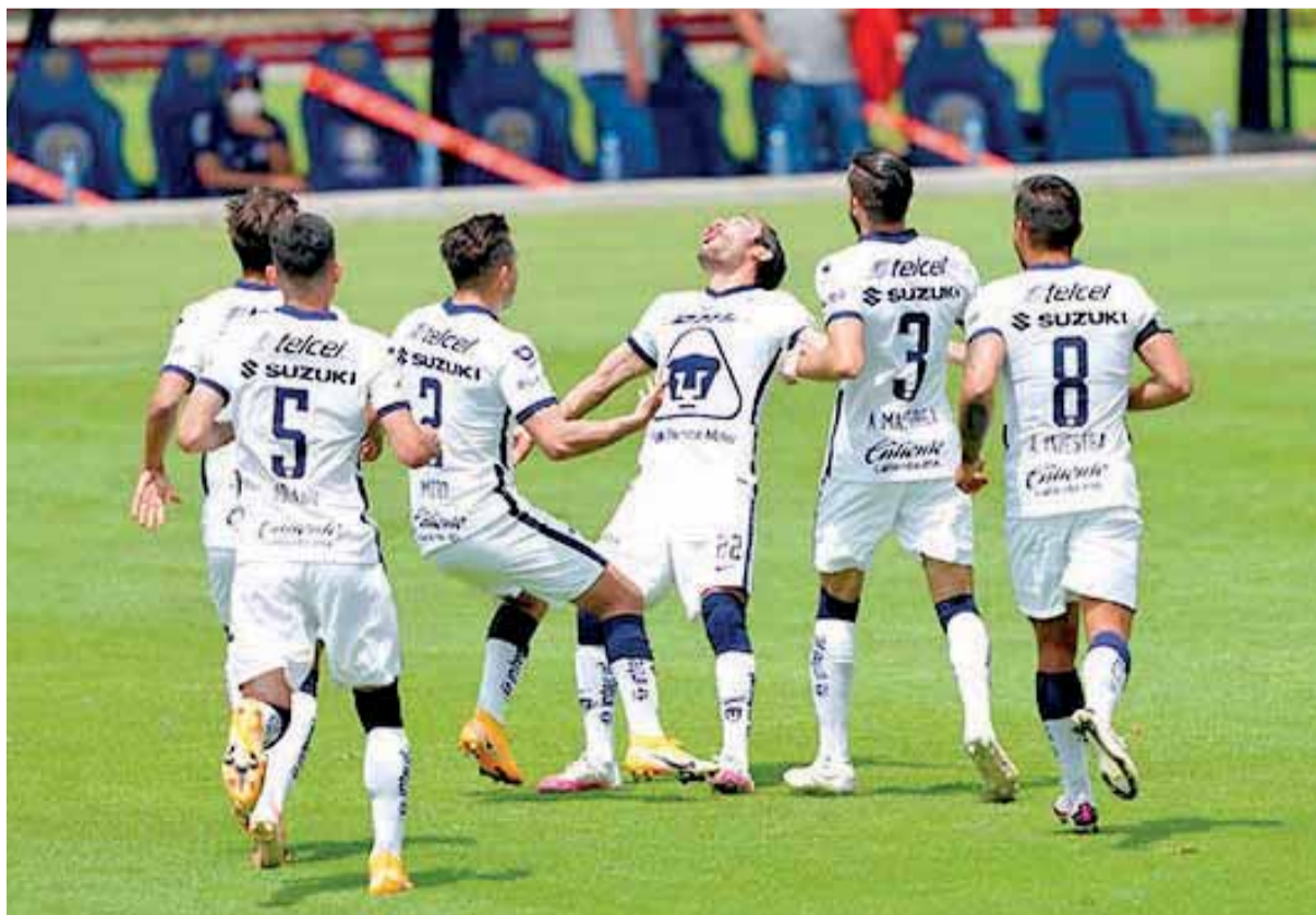
LOS DE LA UNAM golearon en casa al San Luis.