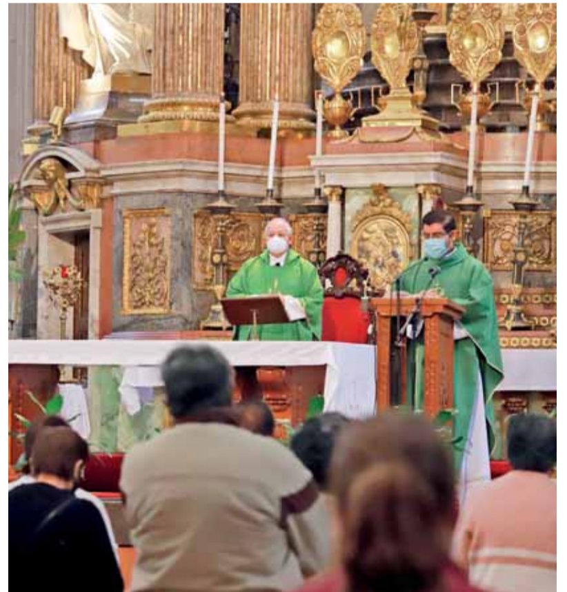
LA MISA se realizó con un aforo reducido.