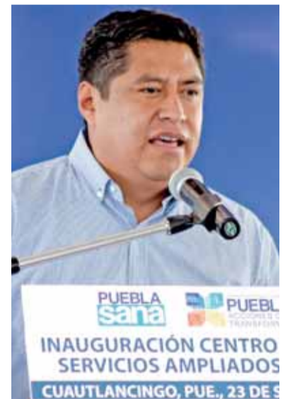
EL EXALCALDE es señalado por daño patrimonial.

los chismes y acusaciones de la edil, debido a que mis cuentas públicas sin excepción fueron aprobadas sin contratiempos, así como no he recibido notificaciones de las supuestas denuncias por parte de Contraloría, la Fiscalía o del Poder Judicial”, remató.