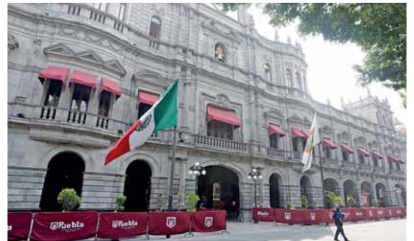
LA CONTRALORÍA Municipal continúa la revisión del expediente de los funcionarios que dimitieron.

"La renuncia la presentaron con fecha 8 de septiembre, ya nosotros procesamos la baja una vez que nos hicieron llegar el trámite administrativo,