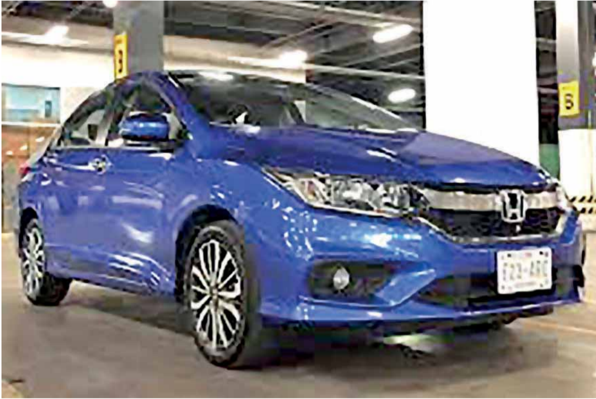
EL HONDA CITY 2019 es otro de los automóviles señalados.

► La dependencia también informó que recibió ocho denuncias en el regreso a clases