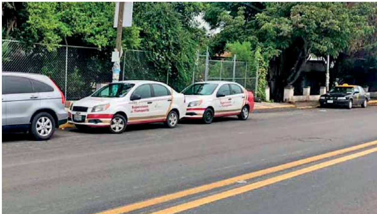
CON APOYO DE grúas, el personal de supervisión retiró taxis que operaban sin permiso y varios mototaxis que aún continúan prestando servicio en esta zona.