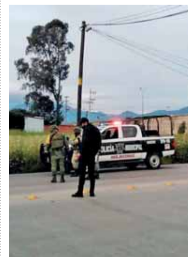
LA UNIDAD transportaba abarrotes y fue robada sobre la federal México-Puebla.

La pesada unidad fue ubicada en el acceso al corredor industrial Quetzalcóatl.