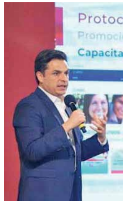
EL OBJETIVO es poner a disposición de los patrones una herramienta en la cual puedan autoevaluar sus protocolos de seguridad sanitaria. . / ESPECIAL

Para finalizar, el funcionario detalló que afortunadamente algunas instituciones educativas, derivado de la pandemia, se solidarizaron con los padres de familia, bajando costos, reduciendo las cuotas o en su caso dando becas.