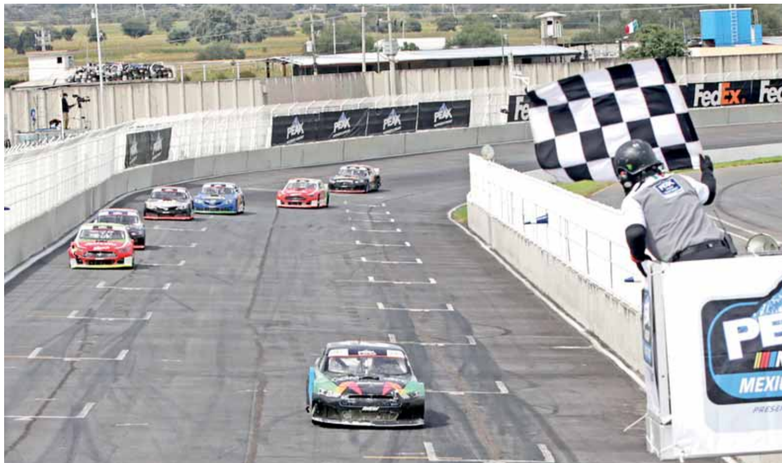
SE DISPUTARON dos carreras a puerta cerrada.