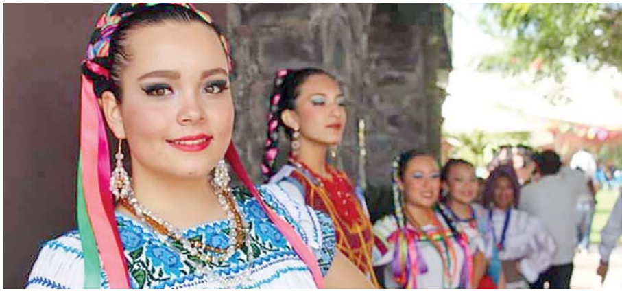
MUJERES EXAGERAN a la hora de maquillarse, deben ser naturales