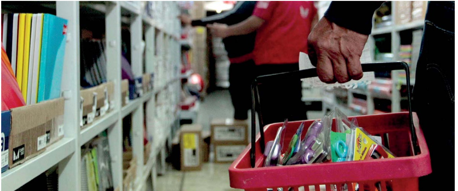
EL DOLOR DE CABEZA de los paterfamilias económicamente hablando