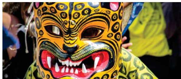
CELEBRACIÓN del Día del Tecuán en la Mixteca pobлана

El Día del Tecuán tuvo una duración de cuatro días de actividades consecutivas, realizadas en el centro de Acatlán, donde