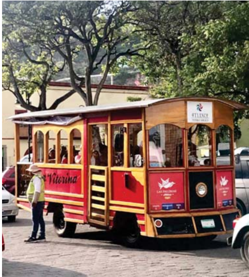
TRES AÑOS de pueblo mágico.