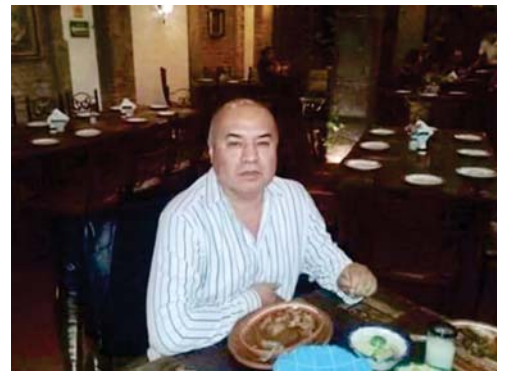
HASTA pronto amigo.

de la ciudad, el recorrido dará inicio en el parque del Ahuehuate a partir de las 10 hrs. Cabe destacar que todos los danzantes serán atendidos con desayuno y comida, en lo que hoy se llama centro de convenciones, en el ex convento del Carmen, si usted, amable lector, es amante de las tradiciones de danza y color, asista al convite el 26 de agosto y presencie el Atlixcayotontli el domingo 2 de septiembre, lleve a sus niños para que disfruten de esta fiesta, pero además, contribuya con su presencia, el año pasado llegaron 4 mil asistentes y las organizadoras este año esperan a 5 mil visitantes. No se pierda esta bonita fiesta.