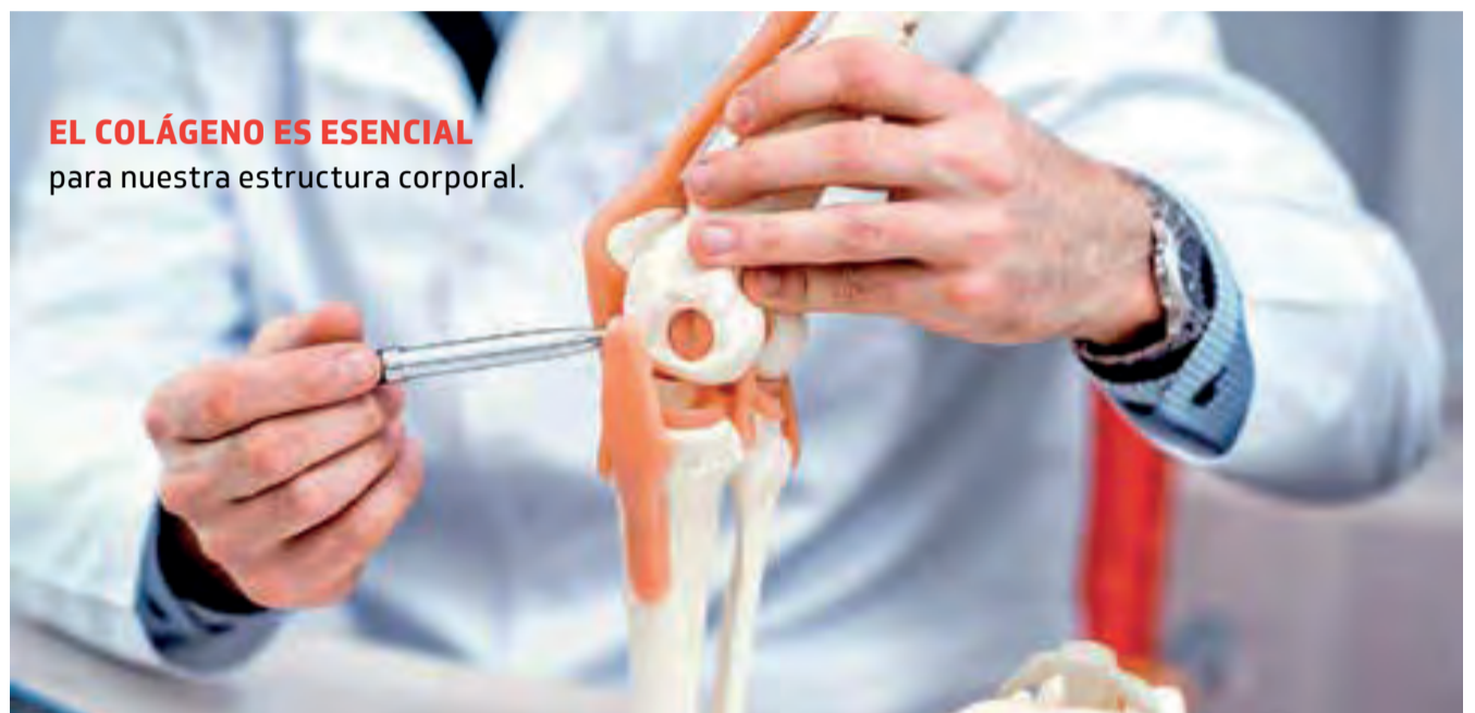
EL COLÁGENO ES ESENCIAL para nuestra estructura corporal.

Envejecer es natural, cómo hacerlo depende de cada uno. Te contamos la importancia de los péptidos bioactivos de colágeno.