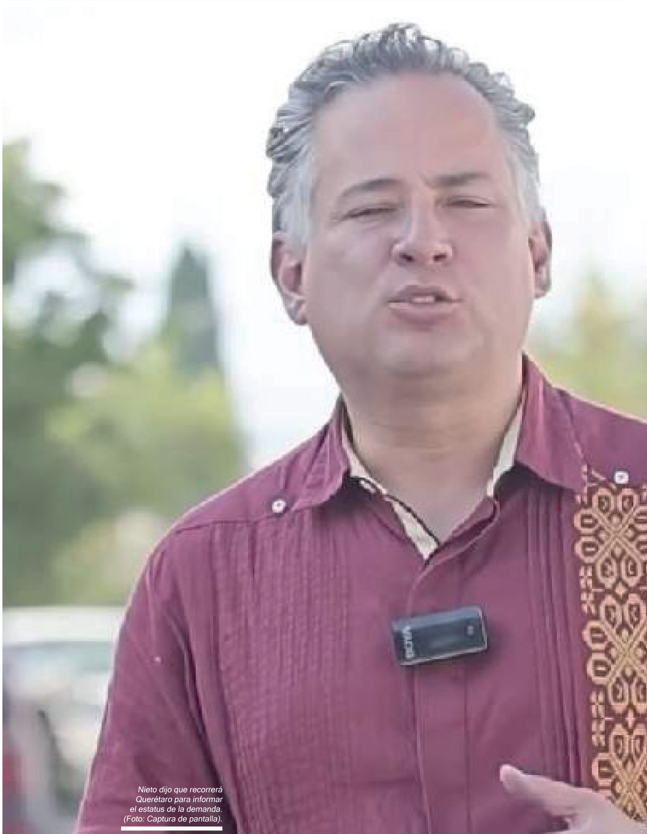
Nieto dijo que recorrerá Querétaro para informar el estatus de la demanda. (Foto: Captura de pantalla).