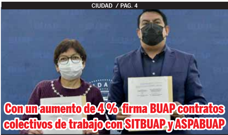
Con un aumento de 4% firma BUAP contratos colectivos de trabajo con SITBUAP y ASPABUAP