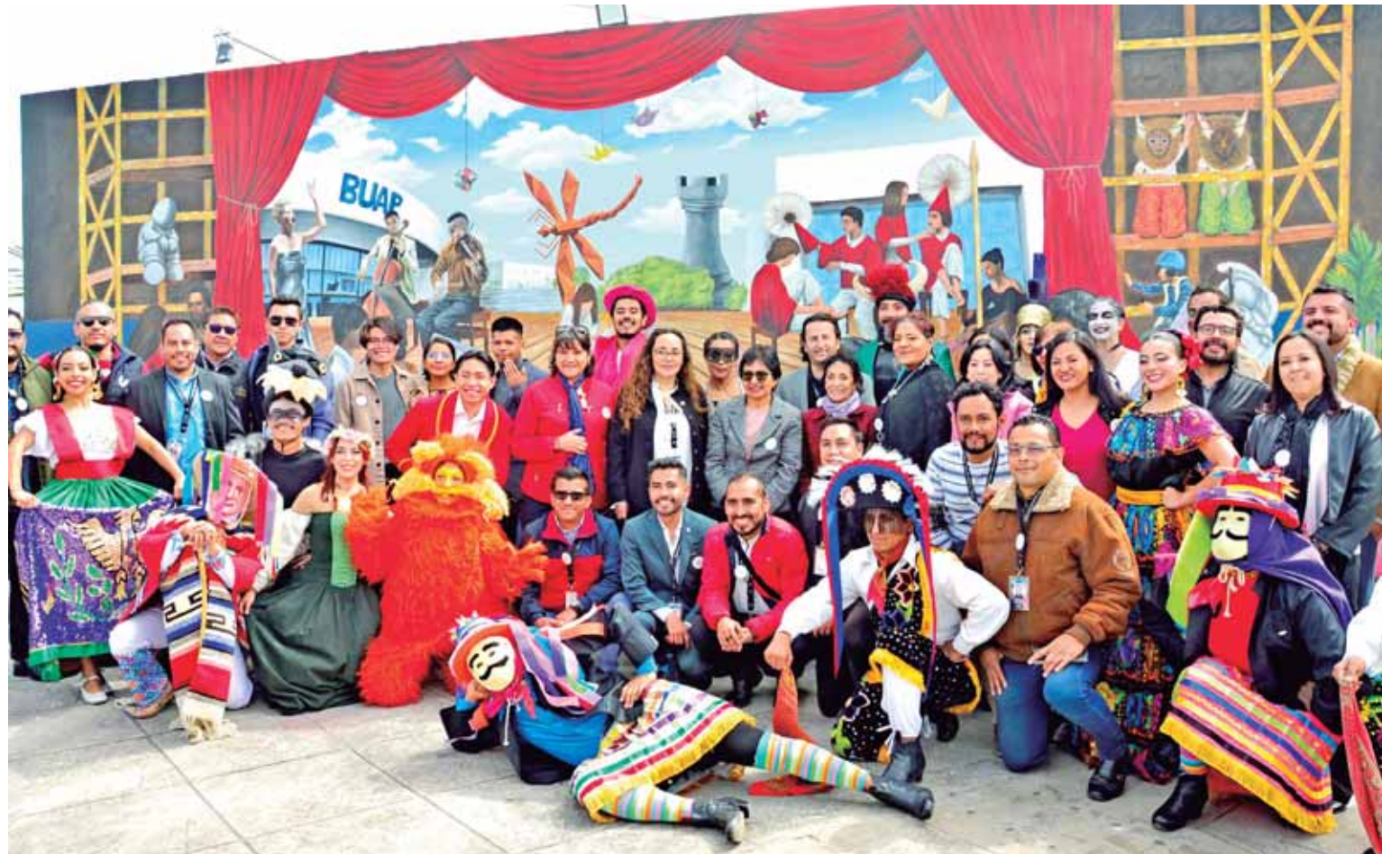
Ubicado en la entrada principal del Complejo Cultural Universitario, sobre Vía Atlixcáyotl