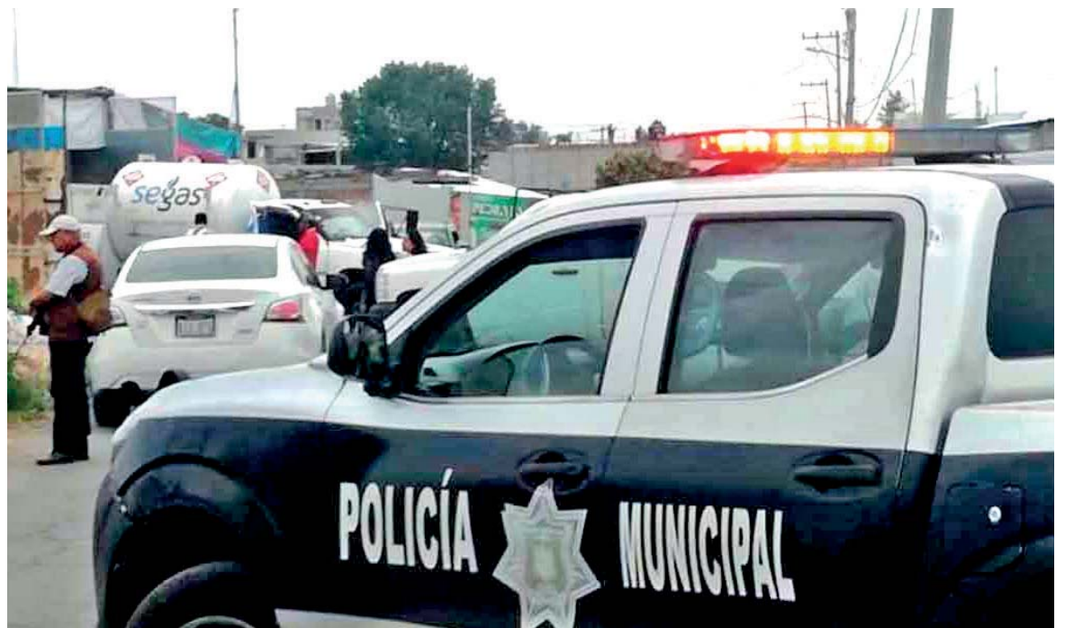
Tras el enfrentamiento y con el apoyo de la Policía Municipal de Texmelucan se pudo ingresar a la vivienda.