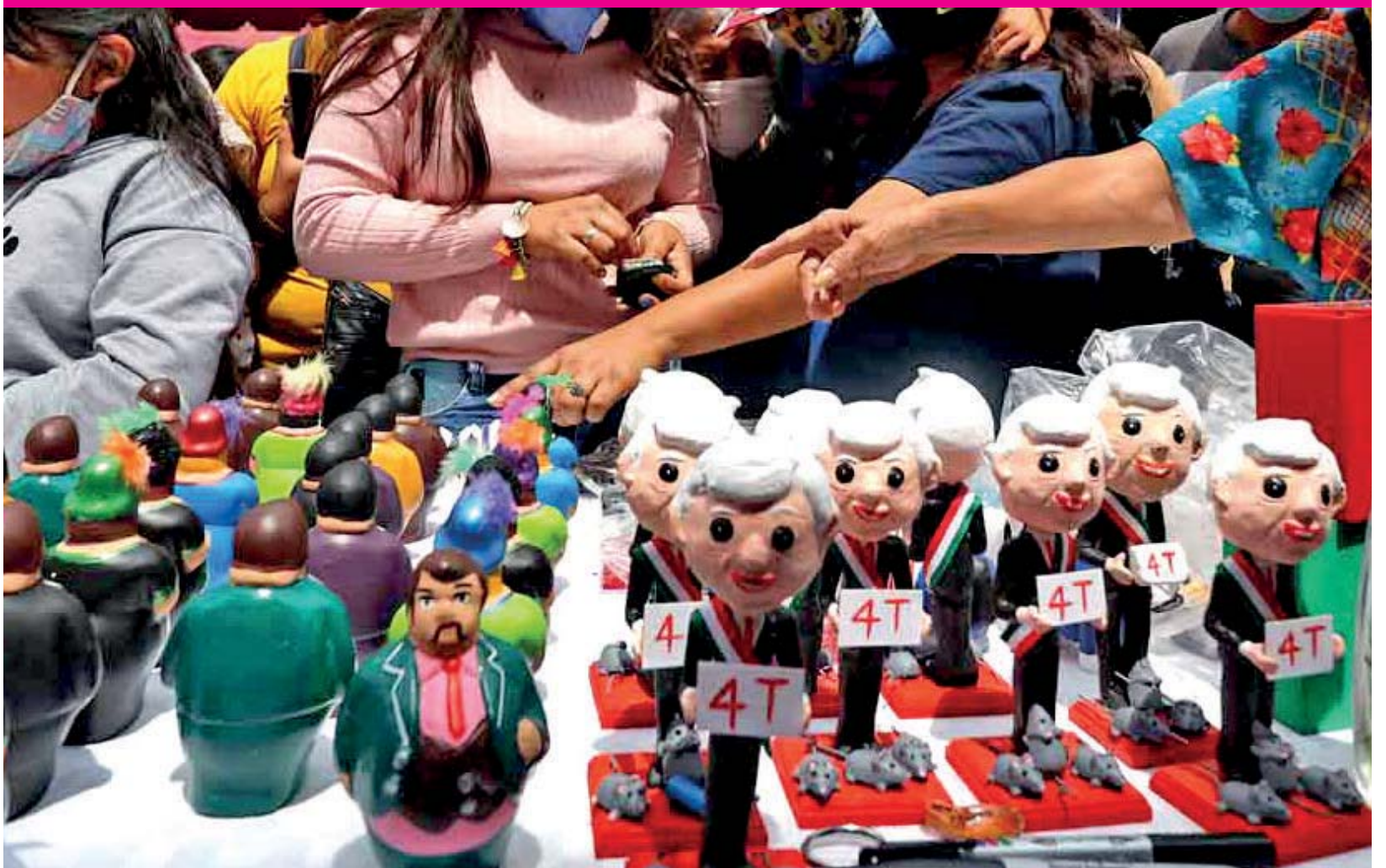
Venta de mulas y panzones tradicionales de la celebración del CORPUS CHRISTI en la zona del Parián, tras más de un año de no celebrarse debido a la pandemia por Covid-19.