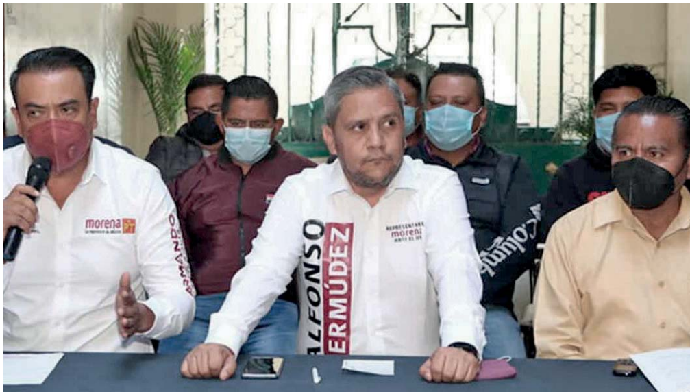
Incluso acusaron que ellos como candidatos han sido sujetos de agresiones por parte del actual edil de Libres, Francisco Rodríguez Rivero que busca de su reelección a toda costa.

En el estado, se ha intensificado un ambiente político violento, principalmente en contra de los candidatos a las alcaldías del interior del estado, que han sufrido desde secuestros has-