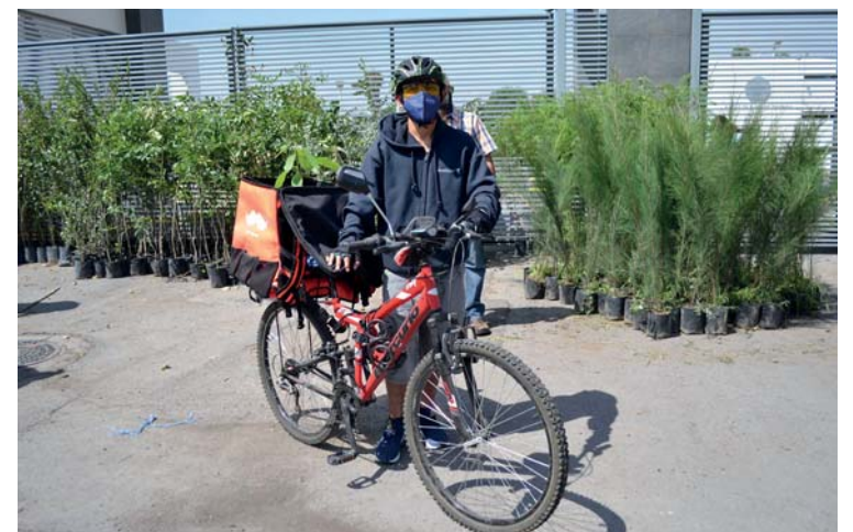
La Coordinación General de Desarrollo Sustentable da continuidad al programa universitario de reforestación iniciado en 2018

Durante una primera entrega, en abril pasado, 250 árboles fueron dados en adopción. Gracias a la gran demanda, en esta segunda entrega se repartieron en total 850 ejemplares.