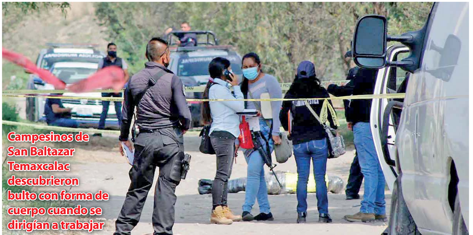
Campesinos de San Baltazar Temascalac descubrieron bulto con forma de cuerpo cuando se dirigían a trabajar