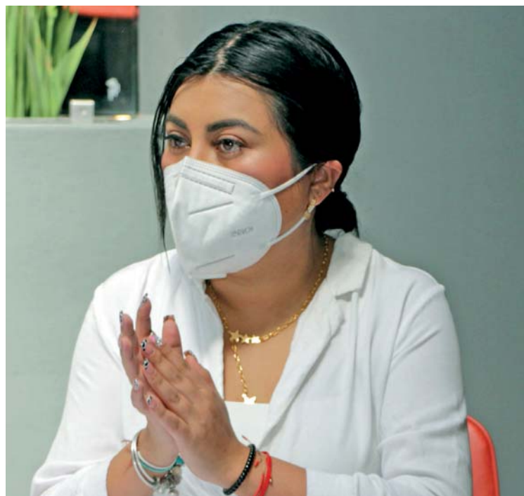
Citó que al corte de este 24 de mayo lleva 81 colonias del distrito.

Citó que al corte de este 24 de mayo lleva 81 colonias del distrito, y este martes y fin de semana tendrá reuniones con mujeres, colectivos y jóvenes quienes han expuesto las necesidades que tienen en la ciudad. ● AURELIA NAVARRO