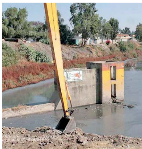
Ariza Salvatori pidió a los poblanos no arrojar basura a las calles, barrer los frentes de casas y alcantarillas, además de evitar tirar cubrebocas o acumular cacharros en las azoteas.