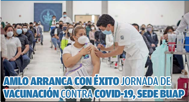
AMLO ARRANCA CON ÉXITO JORNADA DE VACUNACIÓN CONTRA COVID-19, SEDE BUAP