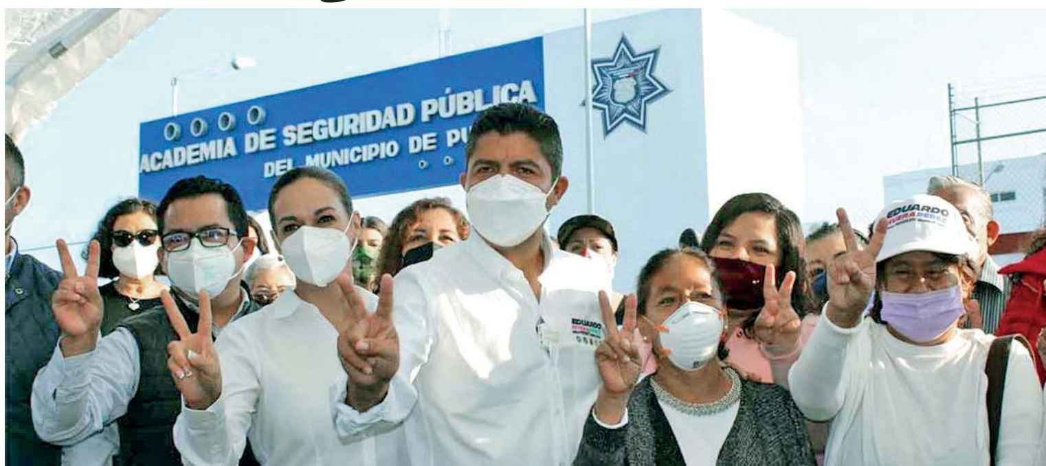
Frente a la Academia de Policía, Rivera Pérez destacó que se dará capacitación en el sistema penal acusatorio para la correcta aplicación de la justicia y así disminuir la impunidad.

El candidato por la alcaldía de Puebla, Eduardo Rivera Pérez, confirmó que las estructuras nacionales del PAN, PRI, PRD, y locales del PSI y CPP desplegarán una cobertura total en las casillas para vigilar los comicios del 6 de junio.