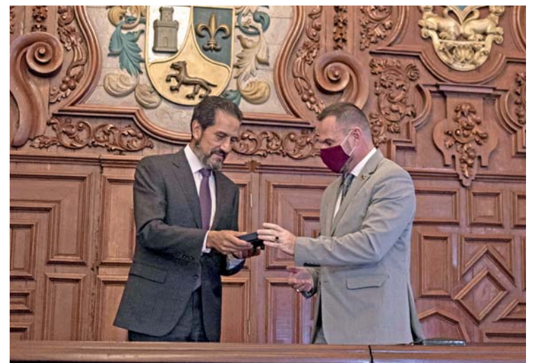
Al recibir el Premio Internacional de Alfabetización UNESCO-Confucio, por las campañas de alfabetización

En el Salón Barroco del Edificio Carolino,