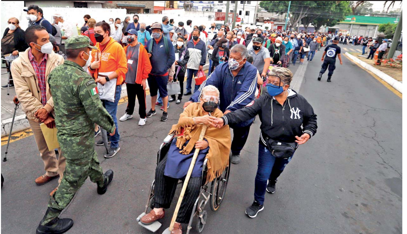
Una multitud de adultos mayores de 80 años o con alguna discapacidad, esperan en la rampa de la XXV Zona Militar para ser inoculados con la segunda dosis de vacuna anti Covid-19.

Lo matan a golpes en anexo de San Andrés Cholula