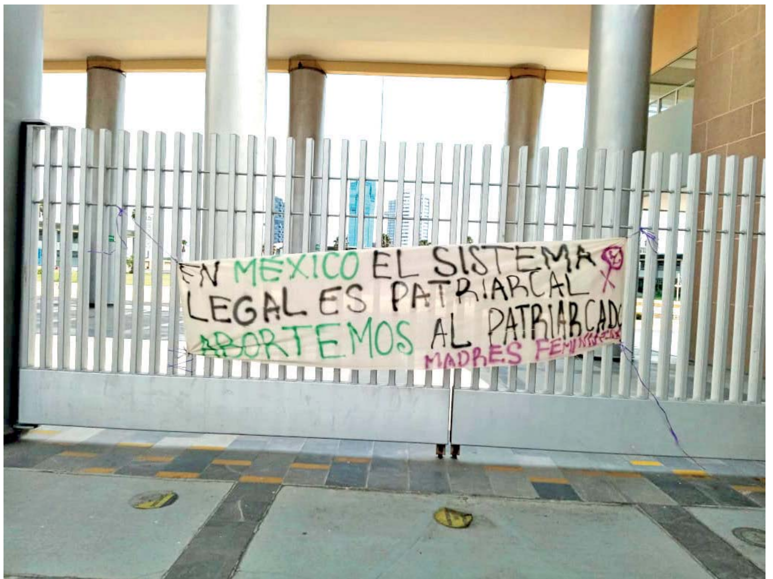
En Ciudad Judicial, justo fuera de juzgados federales en Puebla, decenas de mujeres se manifestaron para visibilizar las desigualdades en juzgados y de parte de juzgadores que, históricamente, han pasado desapercibidas.

Describieron el calvario en los juzgados para tramitar una pensión alimenticia: "Hoy en Puebla hacer éste trámite implica en primer instancia tener recursos para pagar un abogado ,o abogada de lo contrario al acceder a abogados del Estado es