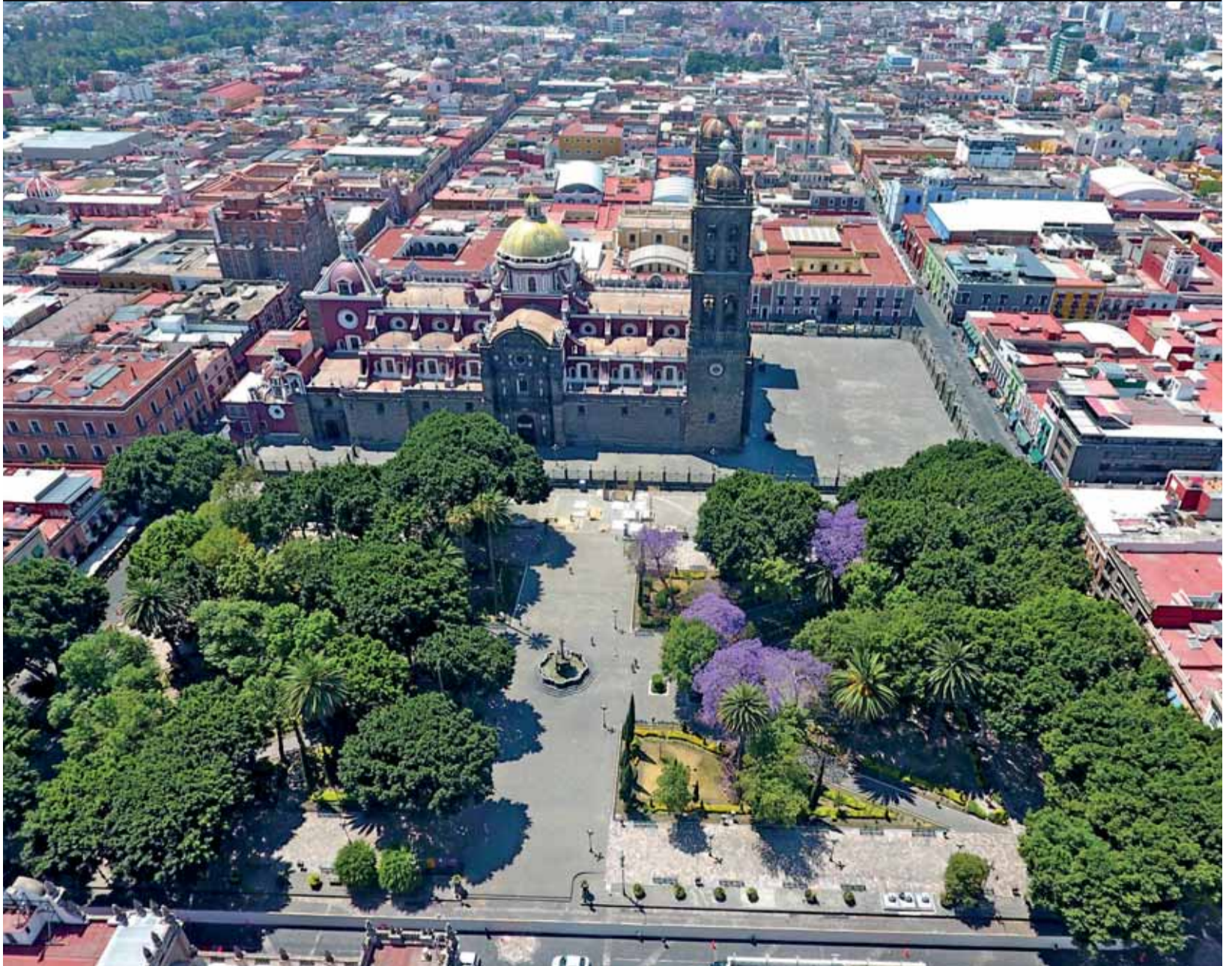
Vista aérea del Zócalo de Puebla donde fue colocada una estructura de madera para obra de rehabilitación.