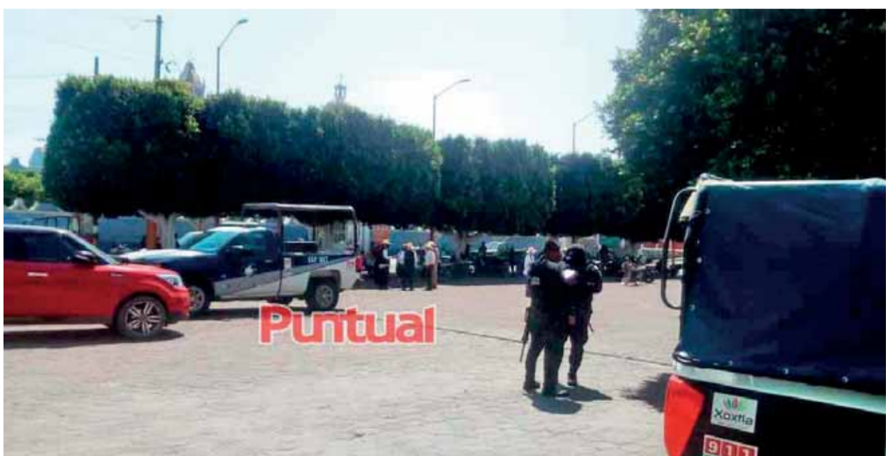
La policía de Teotlalcingo solicitó el apoyo de los policías de Tlahuapan, Tlalancaleca, El Verde y Chiuatzingo.

Cerca de 100 personas arribaron a la presidencia municipal para exigir la entrega de apoyos que el edil había ofrecido anteriormente