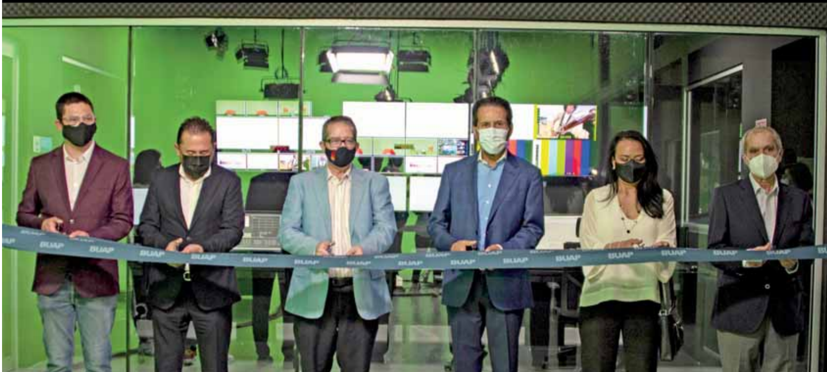
La Universidad siempre ha sido artífice de progreso social y cultural, y TV BUAP será el medio para potenciar este factor de desarrollo entre toda la ciudadanía, expresó el Rector Alfonso Esparza Ortiz, durante la inauguración de los estudios y el inicio de transmisiones de la señal televisiva, a través del canal 18.1 de Puebla.

TV BUAP SERÁ UN MEDIO PARA POTENCIALIZAR EL PROGRESO SOCIAL Y CULTURAL EN PUEBLA: AEO