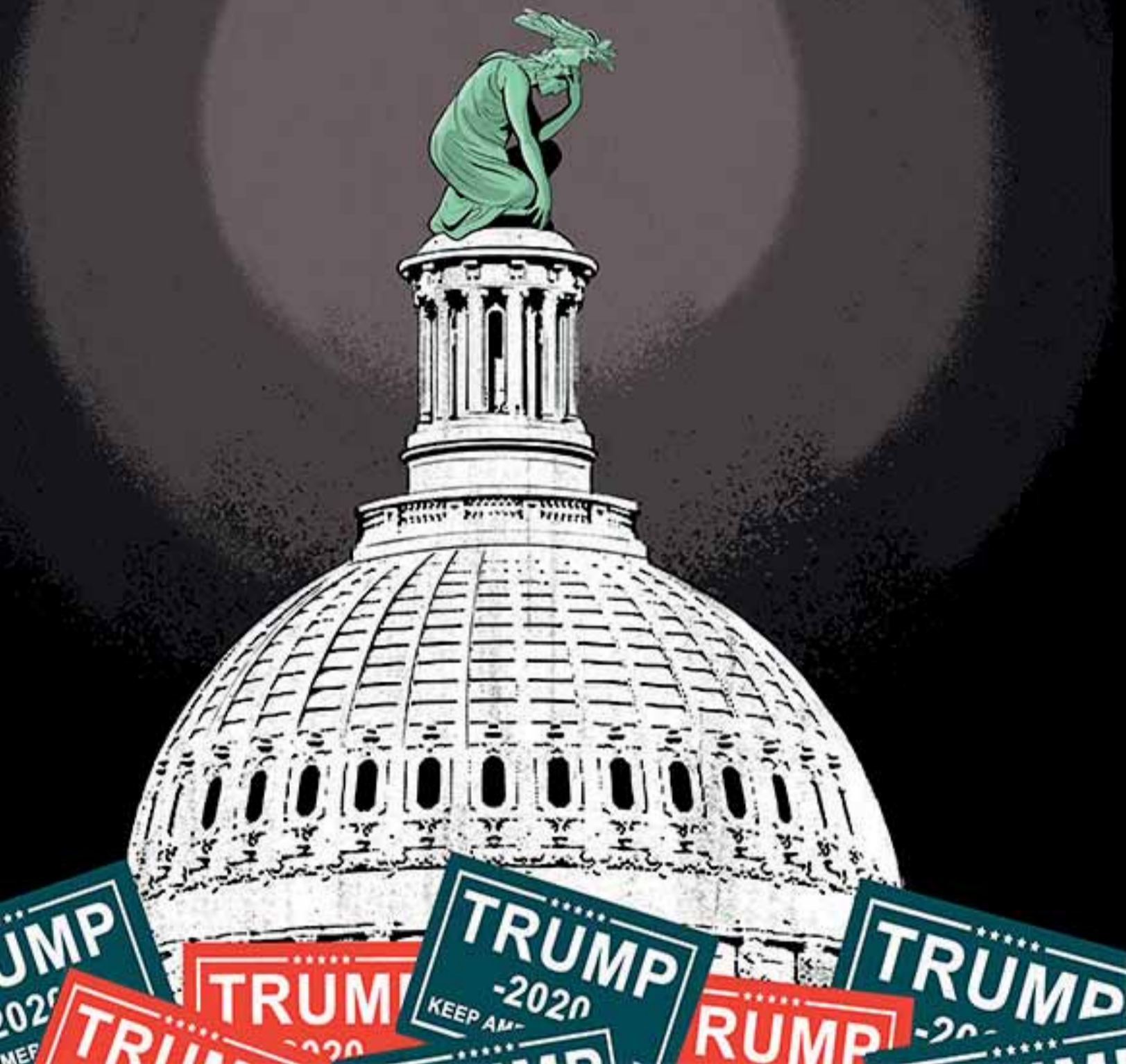
ILUSTRACIÓN: ALEX FINE

rectos más grandes (2,000 dólares en vez de 600 dólares) a los individuos. Trump luego hizo causa común con los líderes demócratas que apoyaban los pagos más grandes, de esa manera puso en riesgo a los miembros de su propio partido, incluidos Loeffler y Perdue.